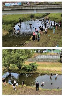
第5回空堀川・川まつりの様子

第6回 空堀川・川まつり 令和6年5月18日(土)に空堀川で「第6回空堀川・川まつり」が開催されます。 「空堀川・川まつり」は、「遊び」「学び」「交流」をテーマに、「まちおこし」「いいまちづくり」のキツカケをつくるものです。 空堀川の自然フィールドに、東大和市民、親子、家族が新しいまちの魅力を発見できる素敵なまつりにしていきましょう。