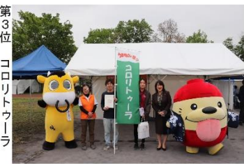
第3位 コロリトウワワ