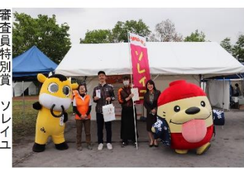
審査員特別賞 ソレイユ