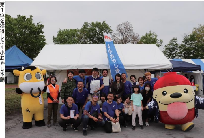
第1位を獲得した4小おやじ本舗

票により次の結果となりました。 ○第1位 4小おやじ本舗「おやじのゆずれないクレープ」 ○第2位 KUJAK U BAKERY ○第3位 コロリトウ「コロリのひよこのコロケ狭山茶チーズとトマトソース」