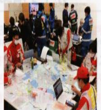
被災地の情報収集を行う赤十字救護班と各関係機関(令和6年能登半島地震)

災害時、赤十字は国の指定公共機関として、自治体をはじめとする関係機関と密に連携し、一刻一刻と変化する被災地ニーズに応じた支援を行っています。