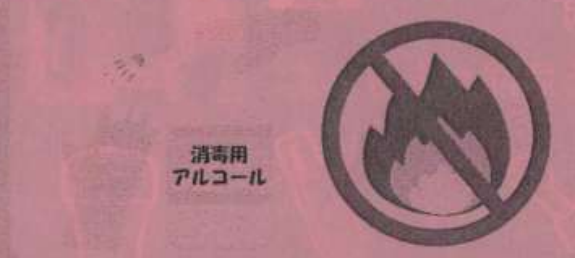
消毒用 アルコール