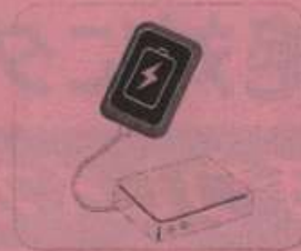
モバイルバッテリー (リチウムイオン電池)