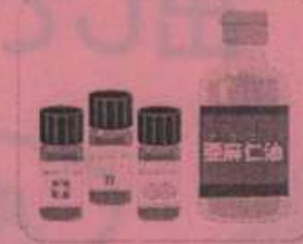
アロマオイル、 動植物油