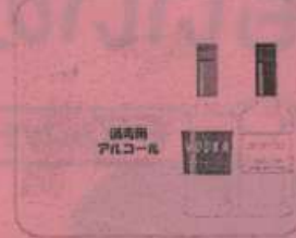
消毒用アルコール、 度数が高い酒類