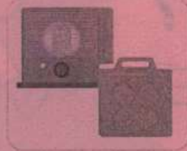
ストーブの燃料 (灯油)