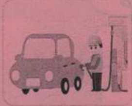
車の燃料 (ガソリン、軽油)