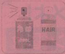
スプレー缶 (エアゾール製品)