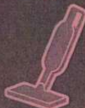
ハンディクリーナー