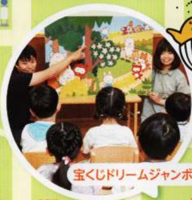
宝くじドリームジャンボ絵本