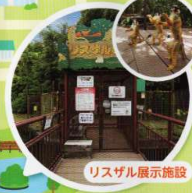
リスザル展示施設

宝くじは、少子高齢化対策、災害対策、公園整備、教育及び社会福祉施設の建設改修などに使われています。