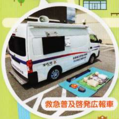
救急普及啓発広報車