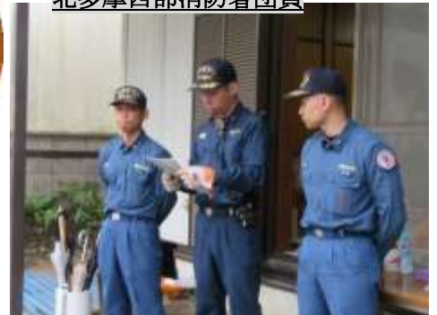
北多摩西部消防署団員