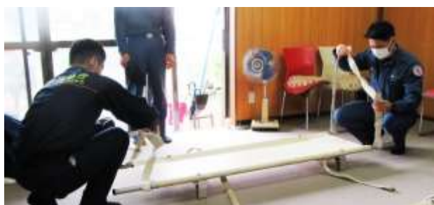
団員による担架構造説明