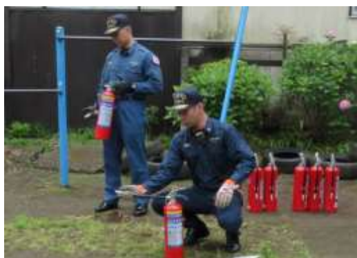
消火器による消火操作訓練状況 団員による操作説明