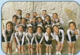
チャリーディングチームStars