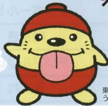
東大和市観光キャラクター うまべえ