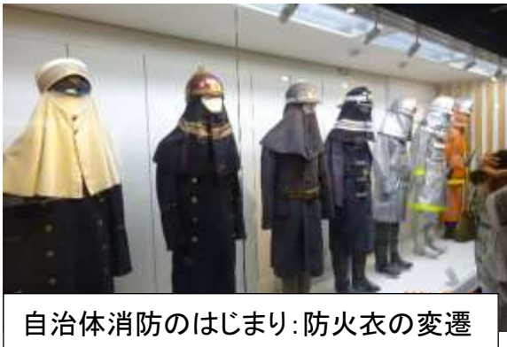
自治体消防のはじまり：防火衣の変遷