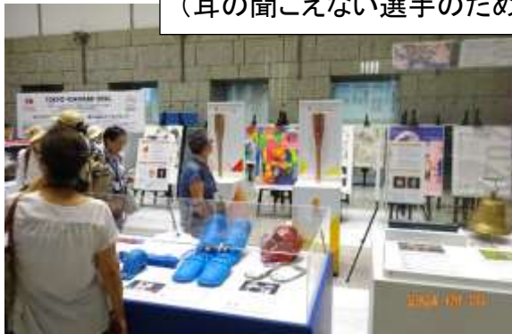
「TOKYO 2025 デフリンピック」の展示 (耳の聞こえない選手のための国際的なスポーツ大会)