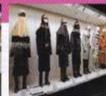
自治体消防のはじまり～防火衣の変遷～