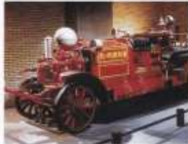
アーレンスフォックス消防ポンプ自動車