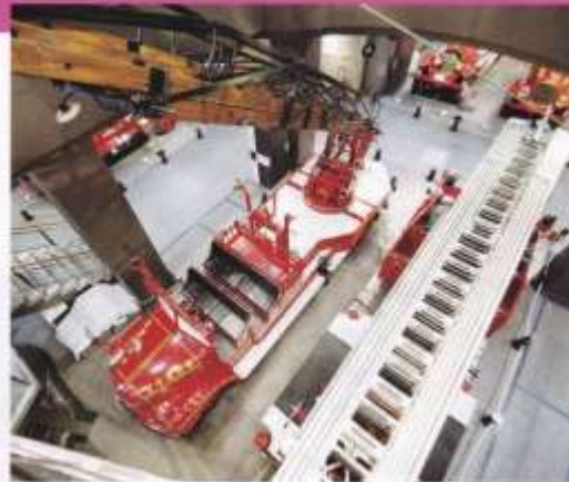
木製はしこのいすゞはしこ車と鉄製はしこのペントックスはしこ車