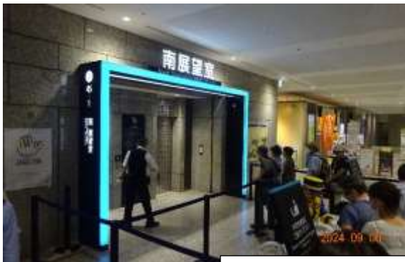
第一本庁舎1階のエレベーターで45階の南展望室へ。