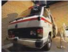
トヨタ救急自動車