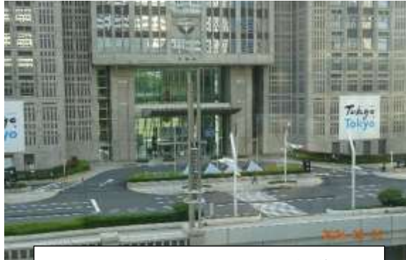
正面入り口前にある横断歩道は、東京マラソンのスタート地点です。