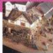
江戸時代の消火風景(ジオラマ)

消防は、江戸時代の火消から始まりました。ここで は、火消の道具や仕事ぶりなどを展示しています。