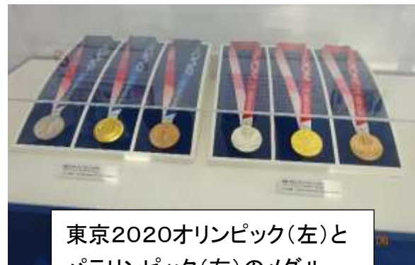
東京2020オリンピック(左)と パラリンピック(右)のメダル