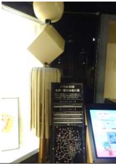
いろは48組 本所・深川16組のまとい