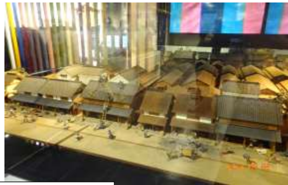
江戸時代の消火風景(ジオラマ)