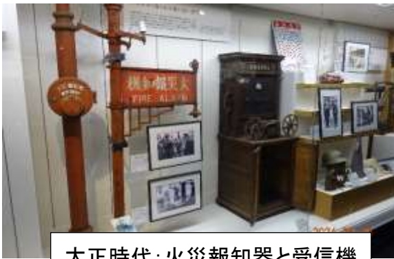
大正時代：火災報知器と受信機