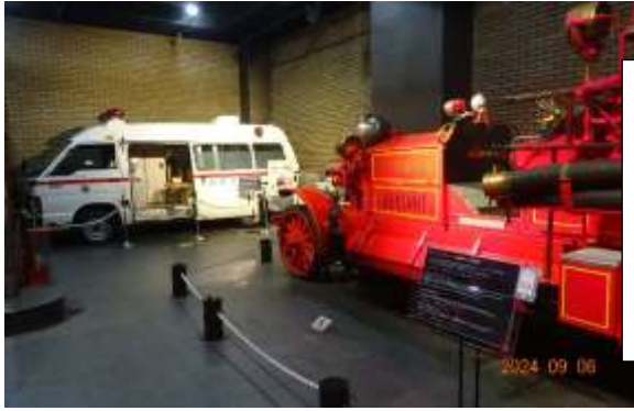
(左)トヨタ救急自動車 (昭和63年～平成8年) (右)アーレンス・フォックス 消防ポンプ自動車 (大正13年～昭和21年)