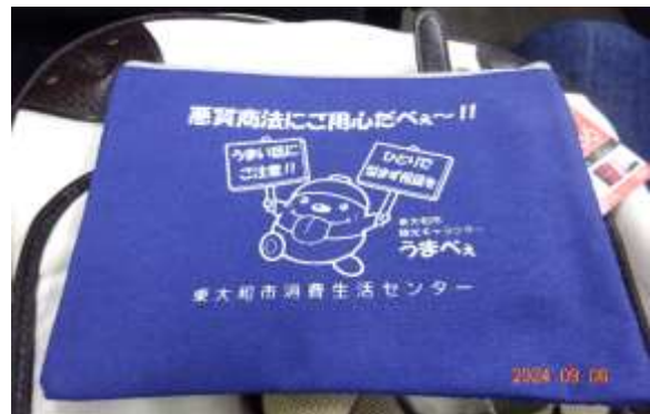
バス内でお楽しみくじ引きで トートバッグなどが当たりました。