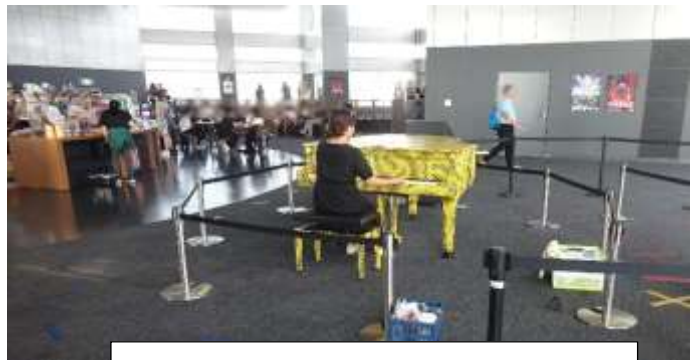
「おもいでピアノ」 装飾は草間彌生さん監修。 1人5分以内で、自由に演奏できる。