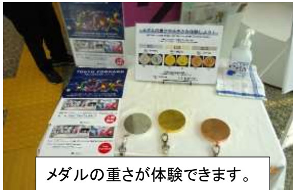
メダルの重さが体験できます。