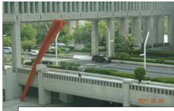
都庁内にある38アート作品の1つ「My sky hole 91 Tokyo」