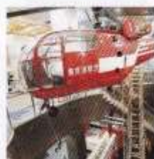
消防ヘリコプター