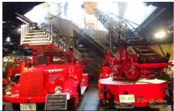
(左)鉄製はしごのベンツ・メッツはしご車(昭和30年～50年)と (右)木製はしごのいすゞ・メッツはしご車(大正14年～昭和46年)の 説明を受ける。