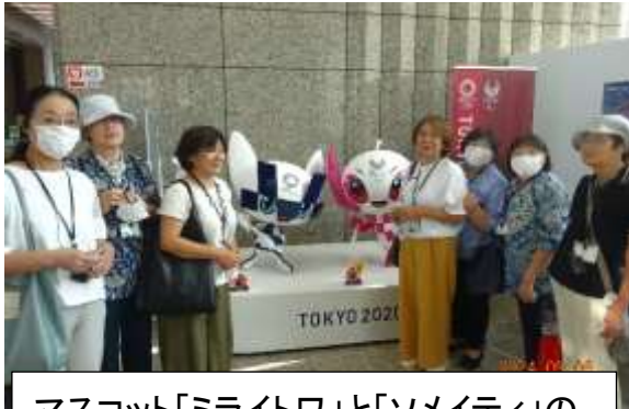
マスコット「ミライトワ」と「ソメイティ」の フォトコーナーにて