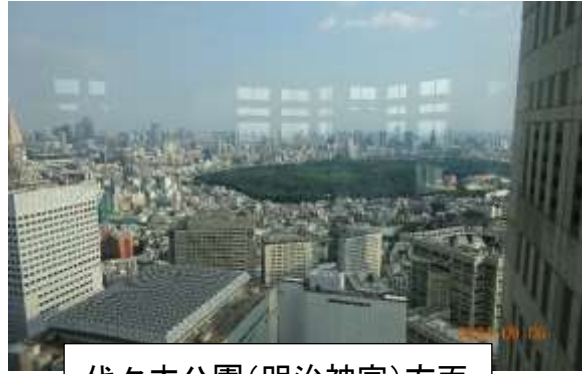
代々木公園(明治神宮)方面