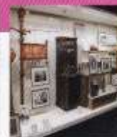
近代消防のはじまり