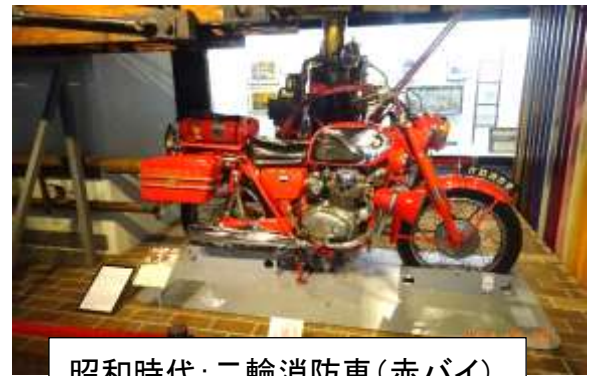
昭和時代：二輪消防車(赤バイ)