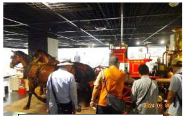
明治時代：馬引き蒸気ポンプ