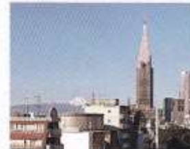
防災ラウンジからの眺め