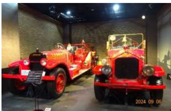
(左)スタッツ消防ポンプ車 (大正13年～昭和28年) (右)マキシム消防ポンプ車 (昭和4年～28年)