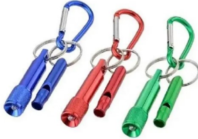
LED ライト&ホイッスル