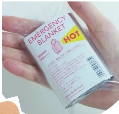
アルミブランケット