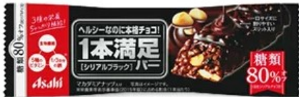
チョコレート、キャラメル、シリアルバー等