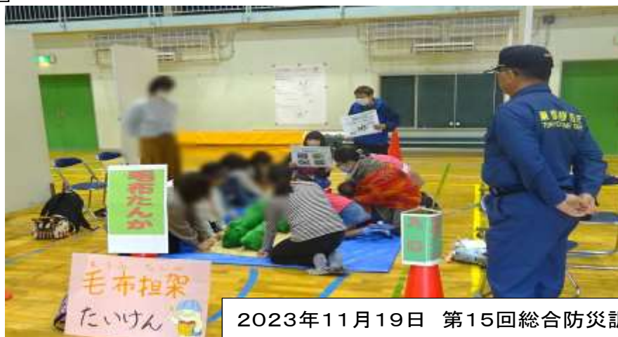
2023年11月19日 第15回総合防災訓練 「楽しく学ぼう防災コーナー」のようす