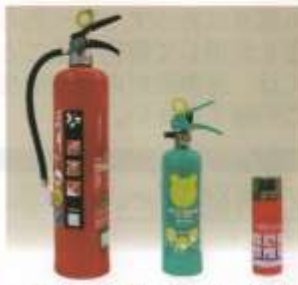
※左から消火器、住宅用消火器、エアゾール式簡易消火具