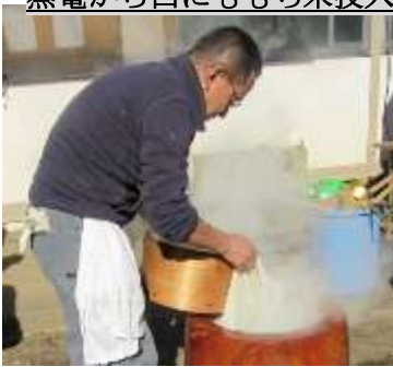
蒸籠から臼にももち米投入