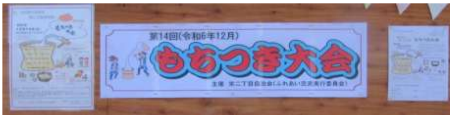
会場入り口の看板

12月14日に南街地区自治会集会所及び同敷地内で、栄二丁目自治会(ふれあい交流実行委員会主催)の標題「年わすれ第14回もちつき大会」が開催されました。当日は多少北風を感じましたが、天候に恵まれ多くの参加者があり、楽しい餅つき大会が開催されました。南街・桜が丘地域防災協議会本部も参加させて戴きました。以下報告致します。