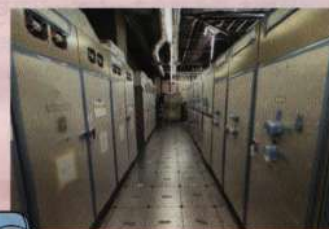
【電気室内に制御盤を設置】