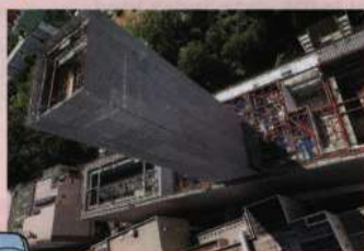
【4・5号ごみ焼却施設煙突から撮影】