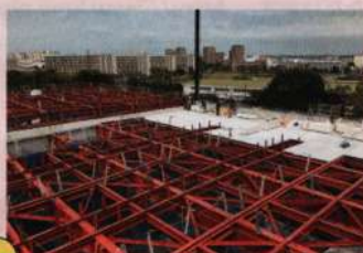
【ごみピットの屋根を施工中】