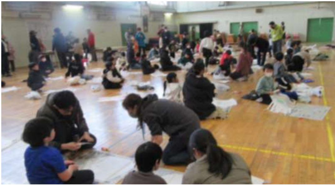
参加児童の「お絵かきの」一例