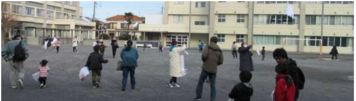
「たこ」の持ち帰り袋の説明