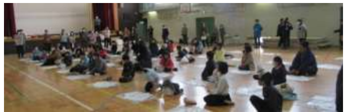
粕谷委員から製作手順説明状況