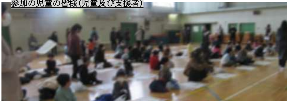
参加の児童の皆様(児童及び支援者)