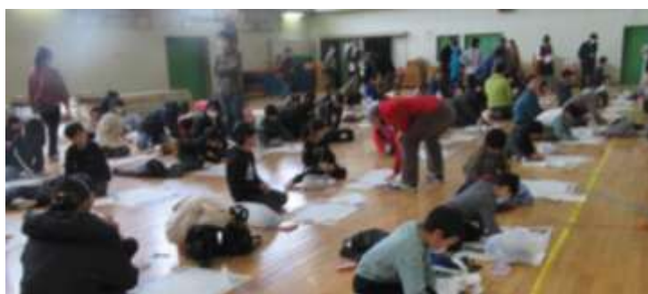
支援者が「たこ」製作のお手伝い状況