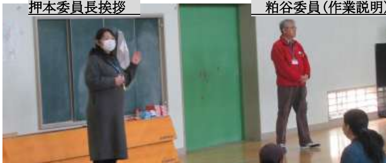
粕谷委員(作業説明)