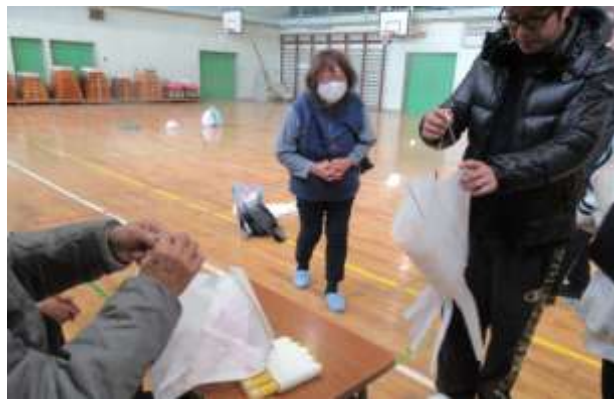
製作した「たこ」を第二小学校校庭で「たこあげ」を行いました