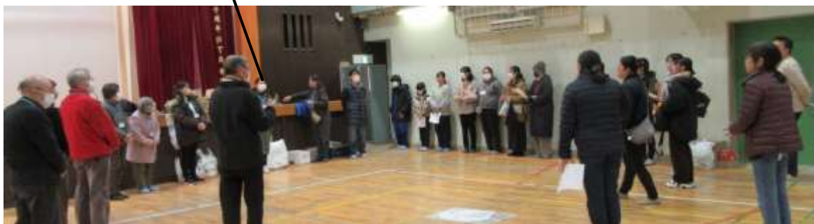
P T A三役の皆様