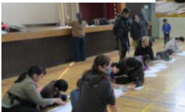
第二小学校校長；大桃様