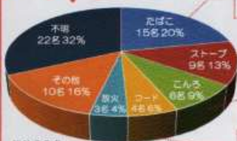
令和3年 出火原因別死者数の内訳