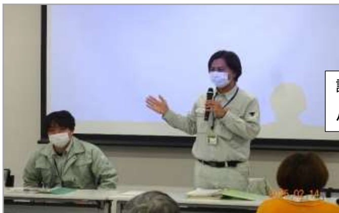
説明及びご案内頂いた 小平・村山・大和衛生組合の職員様