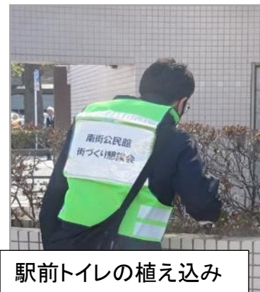
駅前トイレの植え込み