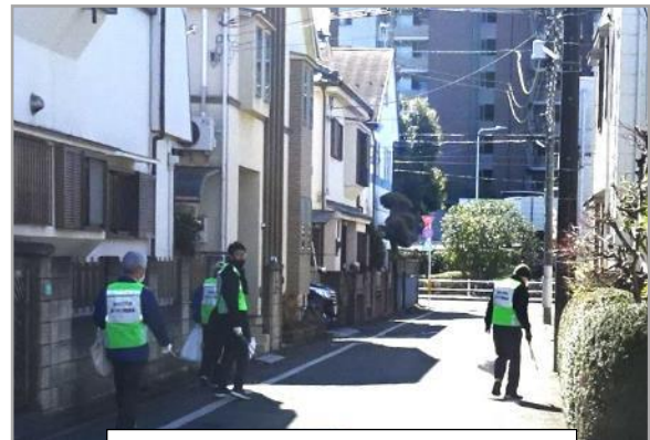
四つ公園から南に向かって