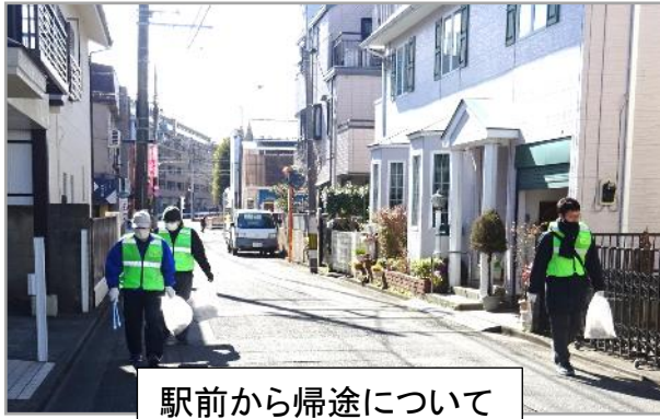
駅前から帰途について