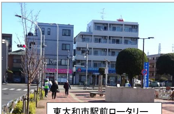
東大和市駅前ロータリー