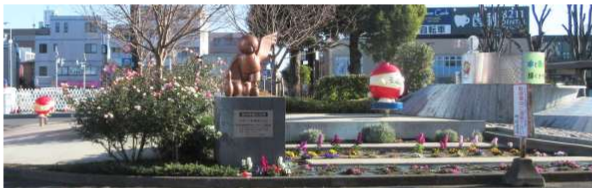
東大和市駅前のモニュメント