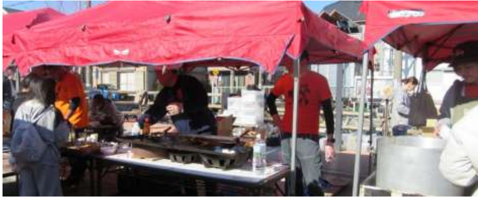
焼きそばコーナー