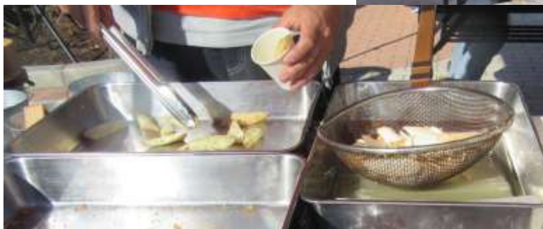
お餅(きな粉／今川／あんこ)コーナー