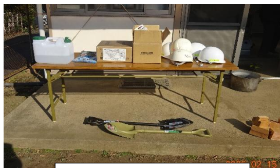
ヘルメット、シャベルなど