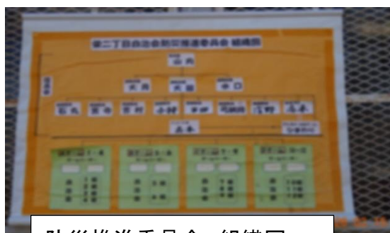
防災推進委員会 組織図