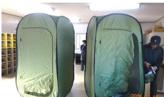
災害時用簡易テント