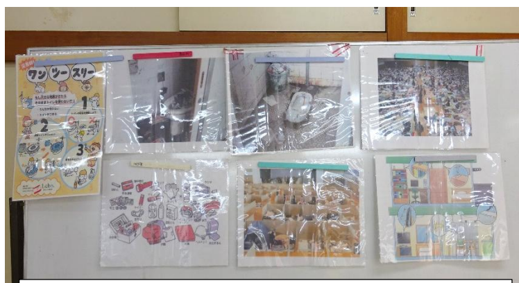
集会所内での掲示 避難所風景、災害時トイレ、非常持ち出し品など。