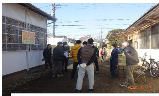
事前打ち合わせ(4班に分かれる)