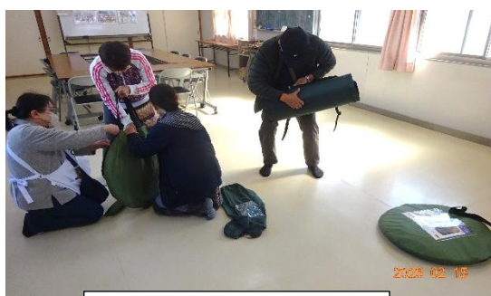
たたむのも訓練です。