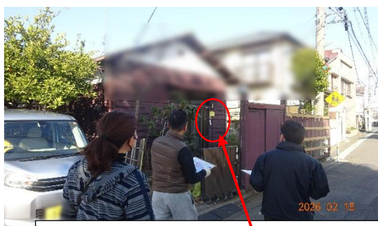
担当班内を巡回し、「無事カード」が掲げられてない場合は、声かけを行う。