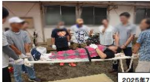
2025年7月12日の動作点検風景