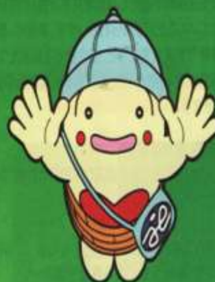
「しゃきょうのたまちゃん」